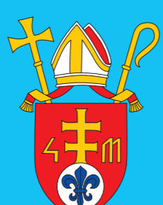
Rímskokatolícka cirkev Biskupstvo Nitra