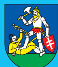
Nitriansky samosprávny kraj